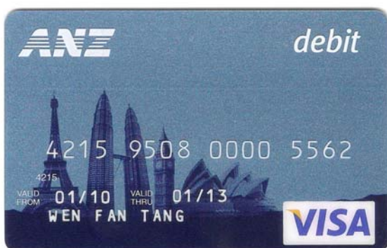
ATM card of Bank ANZ